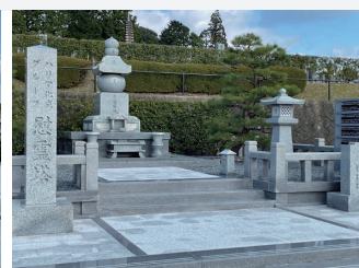
ハリマ化成グループ 様