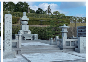
ハリマ化成グループ 様