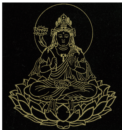
永遠プレート 約 180mm×180mm

終の住まいとも言えるお墓の納骨所。「とわにお護りいただけますように」と願いをこめて、ご本尊を彫刻し納骨所に設置いたします。