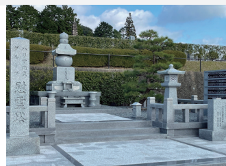
ハリマ化成グループ 様