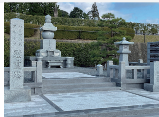
ハリマ化成グループ 様