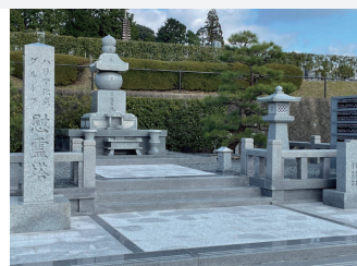
ハリマ化成グループ 様